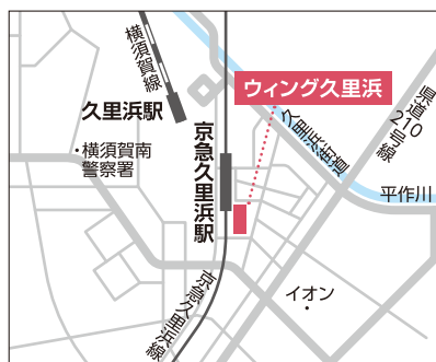
【電車】京急久里浜線「京急久里浜駅」より徒歩1分