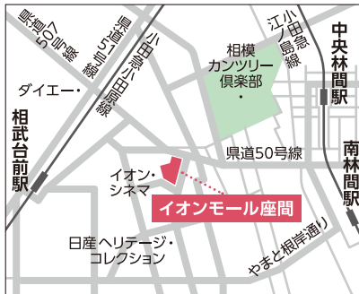
【バス】小田急江ノ島線「南林間駅」より約15分