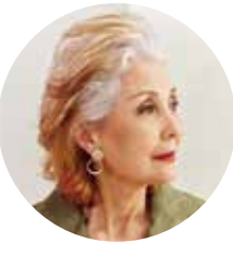
前髪を上げて清々しく