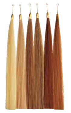
※実際の色とは異なる場合があります。