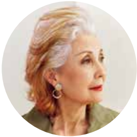
前髪を上げて清々しく