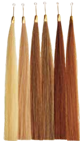
※実際の色とは異なる場合があります。