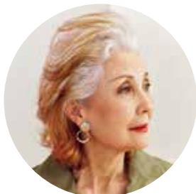
前髪を 上げて 清々しく