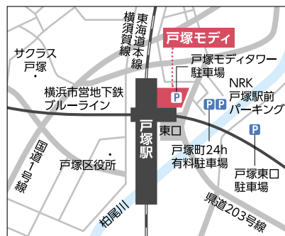
【電車】JR「戸塚」駅から徒歩約1分