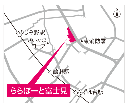
【バス】ららぽーと富士見バス停より徒歩約2分