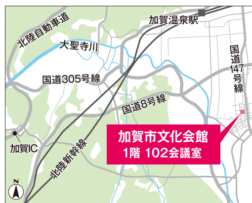
【車】北陸自動車道 加賀IC下車約15分

※当催事に関し、施設(加賀市文化会館)でのお問い合わせは一切受け付けておりません。