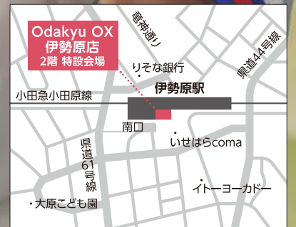
【電車】小田急小田原線「伊勢原駅」直結

4.24[金] - 4.28[火] 午前10時～午後6時 ※最終日は午後5時閉場